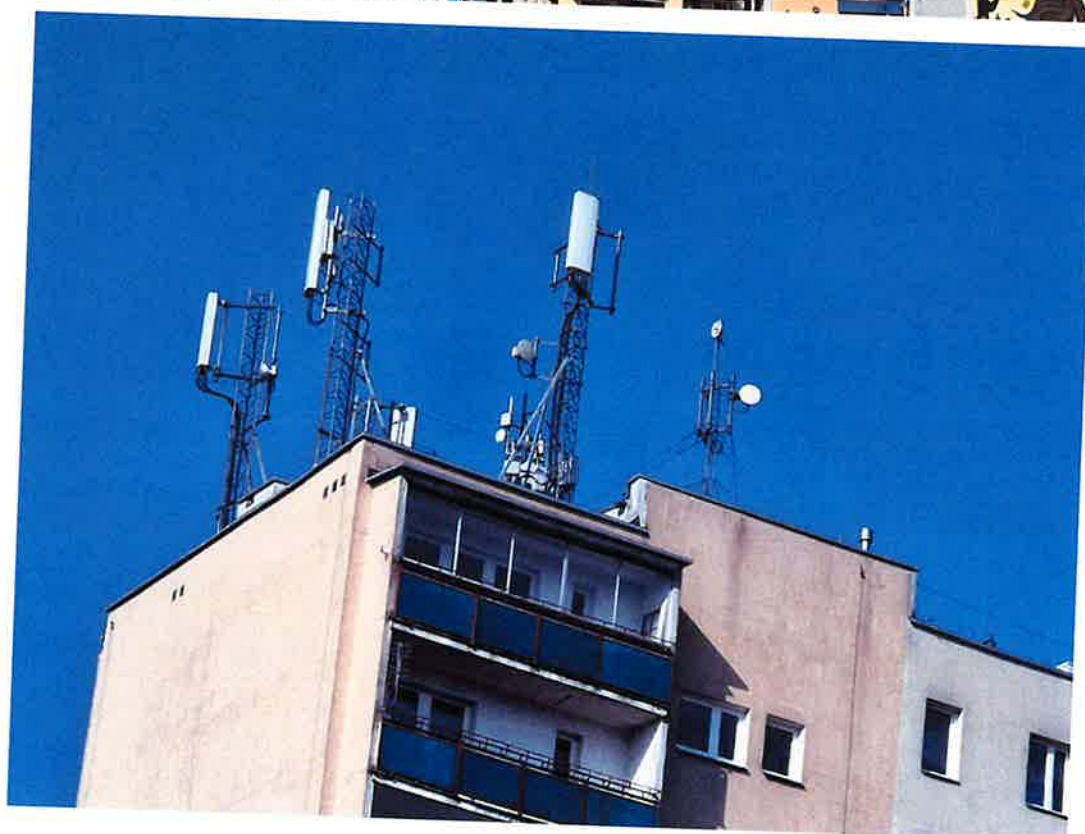
Widok instalacji radiokomunikacyjnej Stacja Netia PIASB021 - PIASM00004 Piaseczno, ul. Szkolna 20.